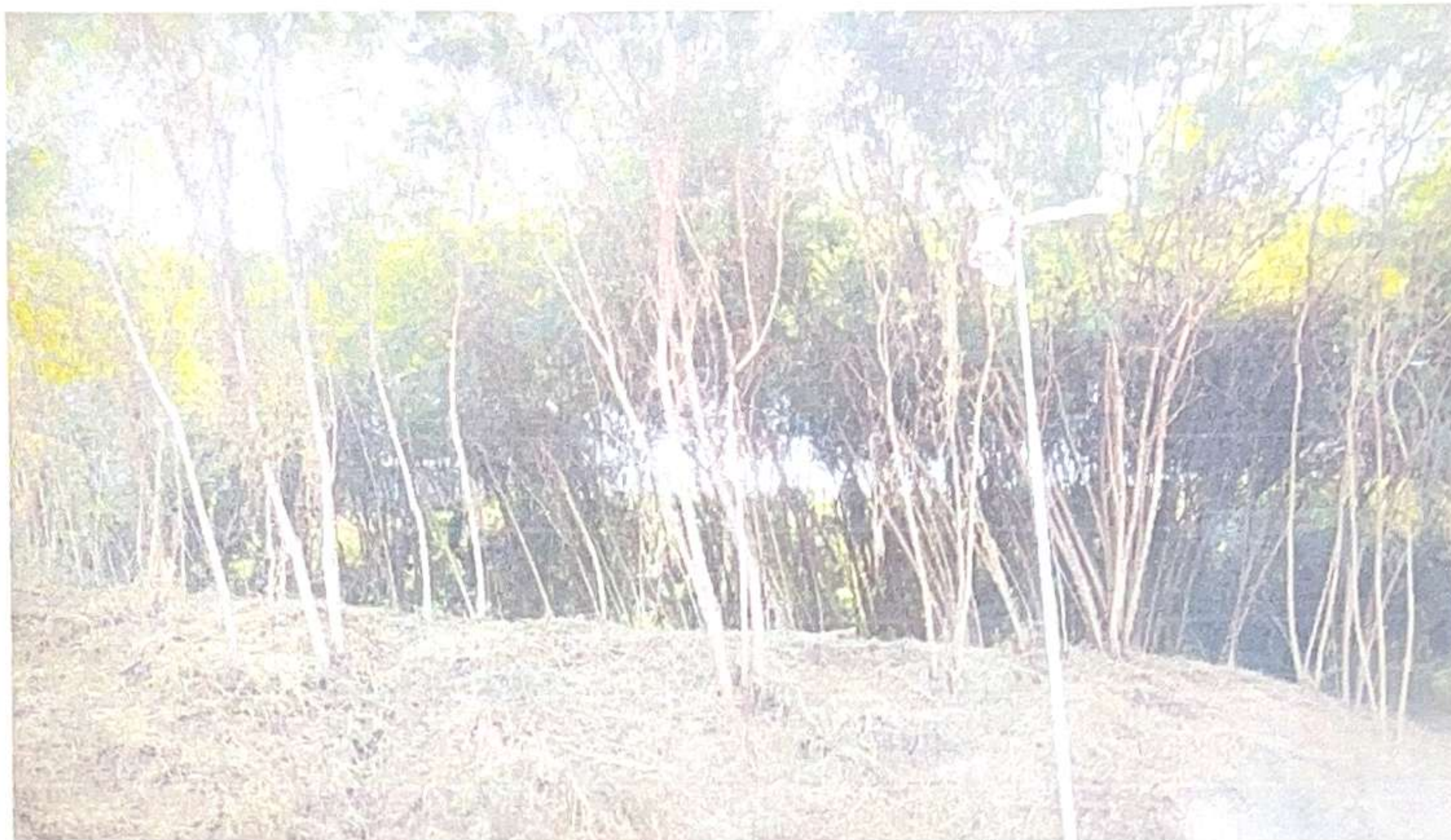
Figuras 1 a 7: FOTOS MOSTRANDO AS ÁRVORES DE ESPÉCIE LEUCENA PRESENTES EM ÁREA PERTENCENTE AO MUNICÍPIO DE FORMIGA (CEMAP).