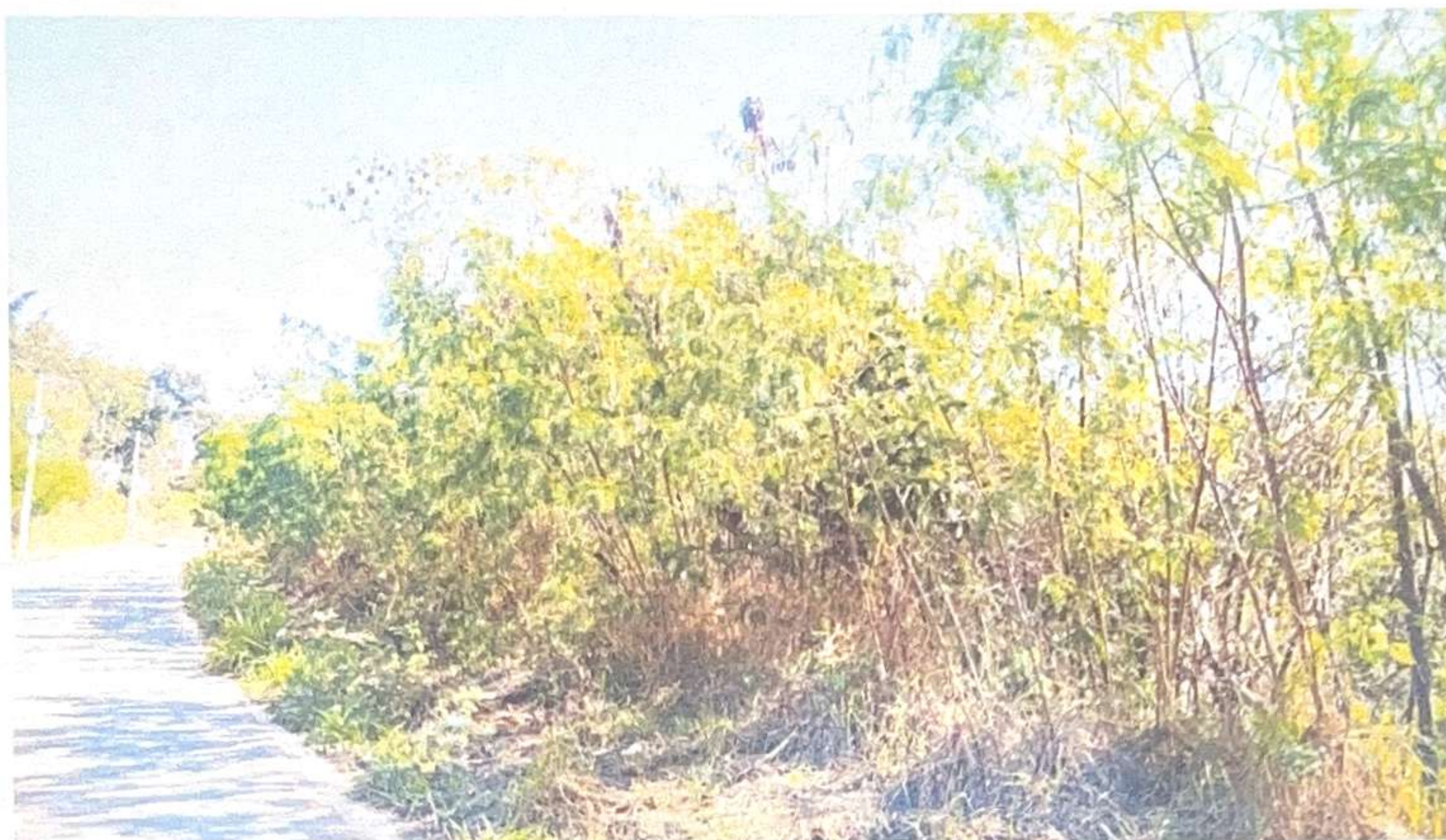
Figuras 9 a 13: FOTOS MOSTRANDO A INVASÃO DE LEUCENAS NAS MARGENS DO RIO FORMIGA, AVENIDAS OLÍMPIO AVELAR E DEPUTADO JOÃO PIMENTA DA VEIGA.