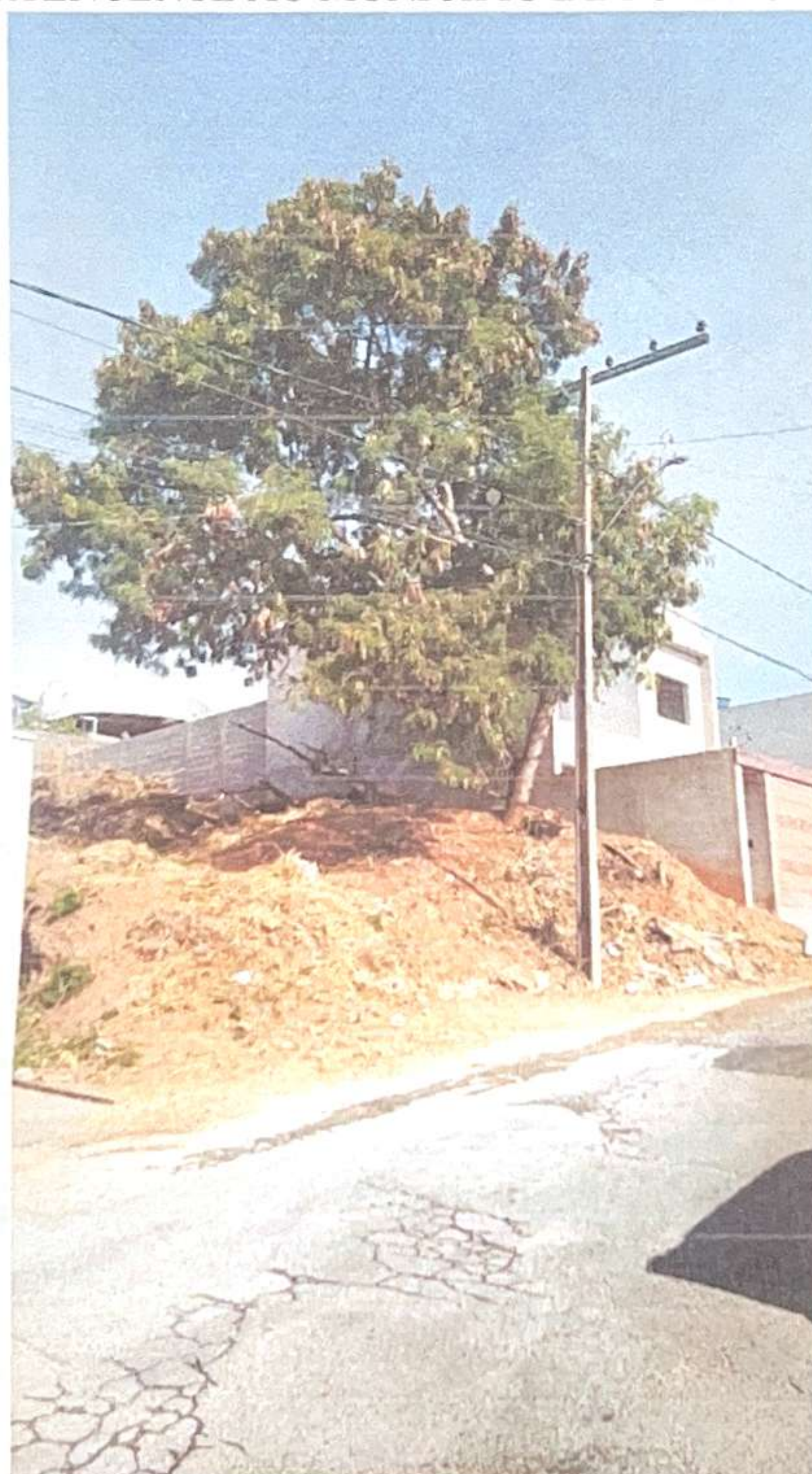
Figura 8: FOTO MOSTRANDO EXEMPLAR EM ÁREA LOTEADA.