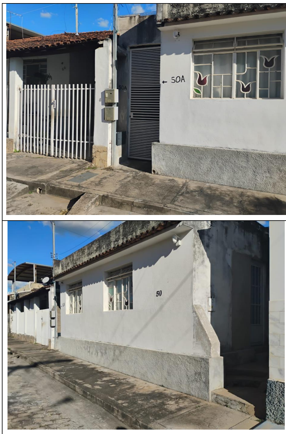
Figura 1 – Residência 50-A e 50, respectivamente